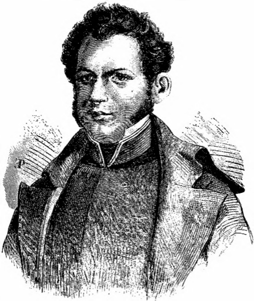
VICENTE GUERRERO .