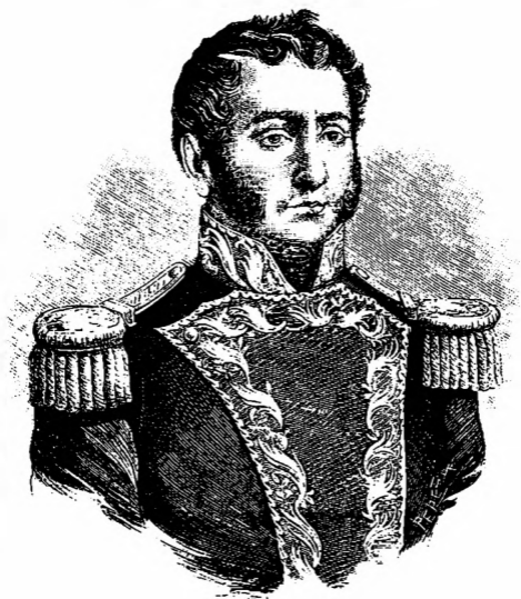
GENERAL D. MELCHOR MUZQUIZ.