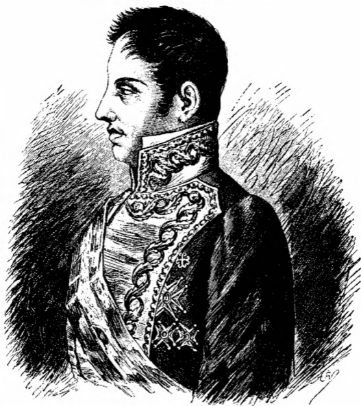
D. Juan O'Donojú